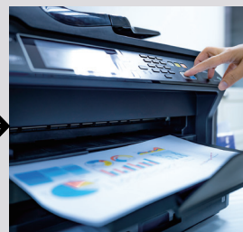
Scanner et imprimante multifonctions